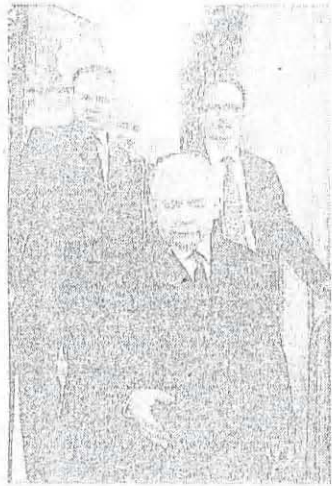
Elöl: Jaroslaw Kaczynski